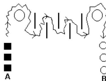
D-28: Parcours - relais